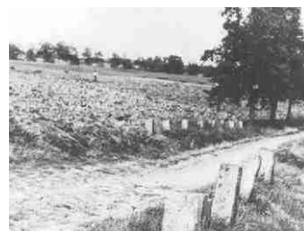
Die einstigen Rieselfelder

„Erlebte Geschichte im Wohngebiet“ ist Thema eines Forschungsprojekts, das der Verein zur Förderung der alternativen Bibliothek Hellersdorf e.V. vor kurzem in Angriff genommen hat. Gesammelt, gesichtet und aufbereitet werden dazu im 1987 bis 1989 erbauten Kiez zwischen Stendaler und Zerbster Straße nicht nur „trockene“ Daten. Vor allem auch Erfahrungen und Erlebtes der Bewohner von einst und jetzt, der Mieter und Vermieter, der Eltern und ihrer Kinder, der Geschäftsleute und ihrer Kunden aus den vergangenen zwei Jahrzehnten sollen in der Kiezchronik bewahrt werden. Das Geschichts-Projekt wird aus Mitteln des Quartiers-