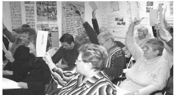
Der Quartiersrat stimmte über neue Projekte ab.

Über weitere Projektanträge, die zurzeit noch nicht berücksichtigt werden konnten, wird der Quartiersrat voraussichtlich auf seiner nächsten Sitzung Ende März 2007 beraten. Darüber hinaus steht