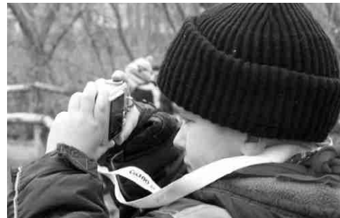
Foto-Knirpse auf der Pirsch

Wenn wir früher auf Spaziergängen fotografierten, hörten wir oft von unseren Kindern: „Lass mich auch mal!“. Unser Aktionsfonds-Projekt „Die Umwelt mit Kinderaugen sehen“ ermöglichte es im vergangenen Jahr, für die Kinder eine leichte, handliche und einfach bedienbare Digitalkamera zu kaufen, mit der sie ihrer Kreativität freien Lauf lassen können. Wir waren überrascht, wie begeistert die Kinder loslegten. Und besonders darüber, was ihnen interessant erschien.