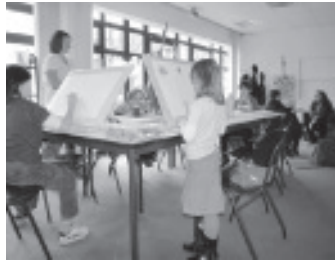
Gemeinsames Gestalten im BildKlexRaum

5€/ pro Person und Woche Als Abschluss wird es eine Ausstellung geben, die mit einem Fest am 8.8. von 11-14 Uhr eröffnet wird.