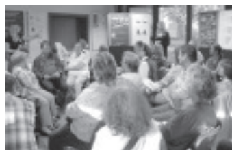
Die Vorstellung der Ergebnisse: lauter interessierte Gesichter

Die meisten Befragten informieren sich in der Presse über Aktivitäten im Quartier. Wei-