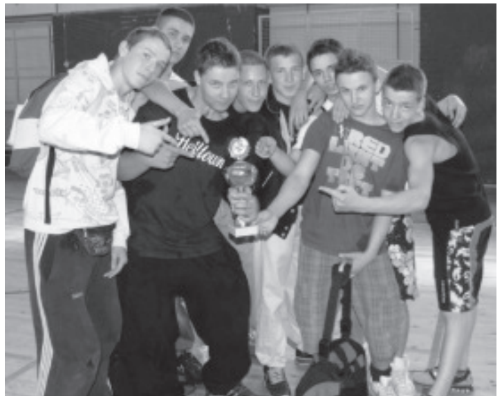
„Einen Pokal haben wir schon ...“ - und der nächste folgt bestimmt!